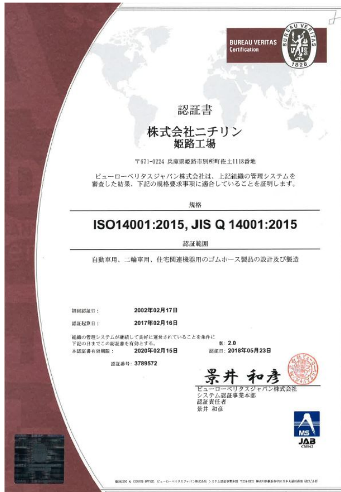
ISO14001:2015 年版 認証書

環境保全の取組みを組織的、体系的に実施するための手段として、また第三者より実施の状況を確認する手段として ISO14001 の認証を 2002 年 2 月に取得致しました。